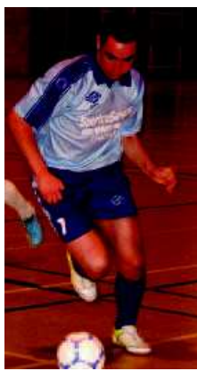
De Jonghe: "Bilan positif". ■ NT